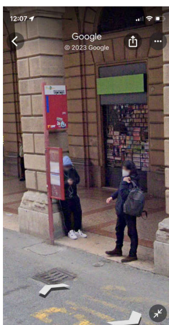
74 Via dell'Indipendenza

Star Hotel: https://www.starhotels.com/en/our-hotels/excelsior-bologna/