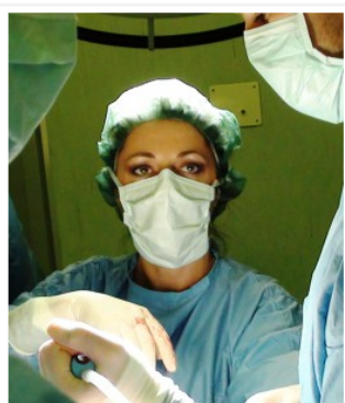
la chirurgia è (anche) donna

25 giu noi chirurghe nate negli anni '50-60